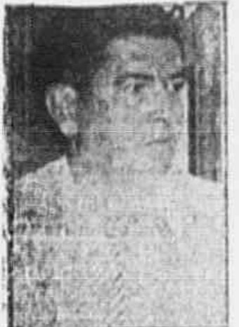
Histor de Carreirão, Presidente do União Geral das Escolas de Samba

Lançadas as bases do Grande Concurso Popular da UGES e TRIBUNA POPULAR — Mobiliza-se o povo carioca para a sua tradicional festa