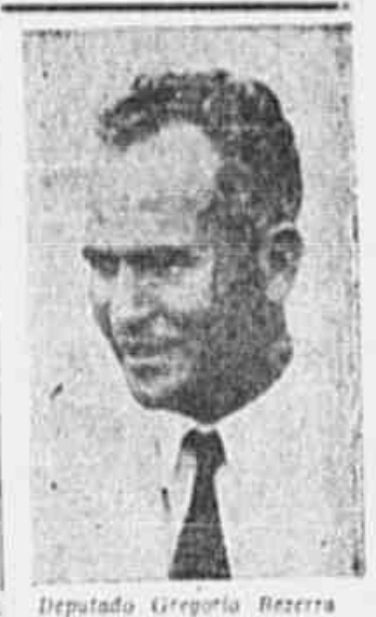
Deputado Gregório Bezerra

Metade do tempo da sessão de ontem, na Câmara dos Deputados, estava reservada às homenagens tribuídas à memória dos mortos da Revolução de 35. Entre os partidos com representação ali, apenas o PSD e o PR — este hoje quase fundido com o primeiro — designaram oradores para falar de uma questão anti-fascista, suscitada pelos elementos mais reacionários com assento na Casa. A bancada comunista, desta feita, designou o sr. Gregório Bezerra para falar sobre a data, profetizando que aquele deputado em discurso, que publicamos em outro local, e no qual luto com seriedade e justiça as causas e as finalidades do movimento de 35.