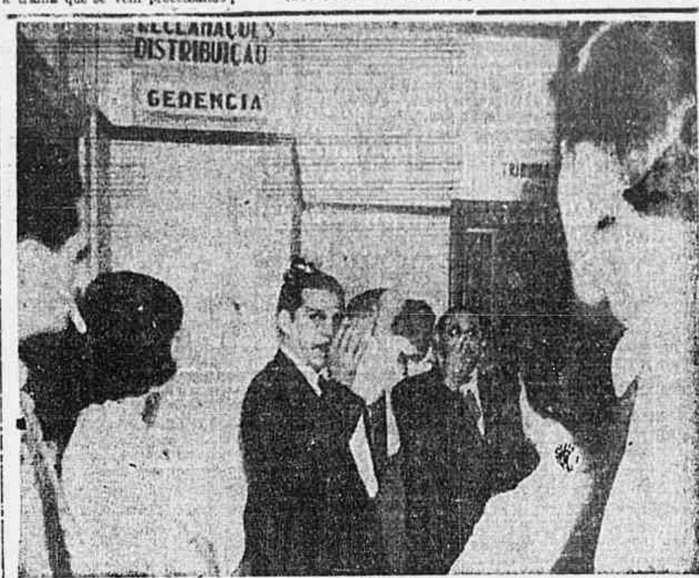
Flagrante feito em nossa redação, tendo-se os dois indivíduos que pretendiam correr todas as dependências da nossa redação, procurando ocultar o rosto