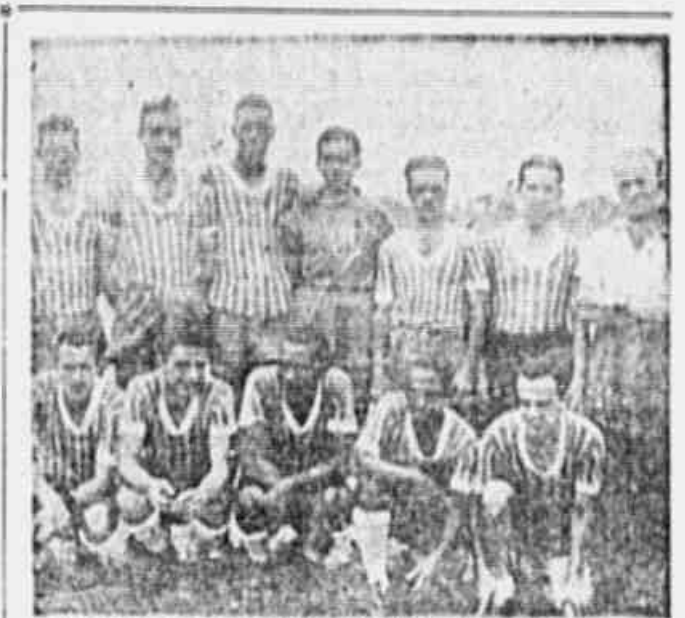
OS DEFENSORES DO S. C. HORIZONTE — A grande vitória, mostra a equipe do S. C. Horizonte, um dos concorrentes ao "Campeonato Popular", e que, segundo informações que obtivemos de fonte autorizada, tem classe suficiente para disputar os duros obstáculos que o certame naturalmente apresentará. Os dirigentes do S. C. Horizonte mostram-se animados e confiantes em conseguir tantas vitórias sobre os seus adversários.

forte agremiação do bairro que lhe dá nome. O último a fazer sua inscrição, foi o 7 de Setembro P. C. do Leblon.