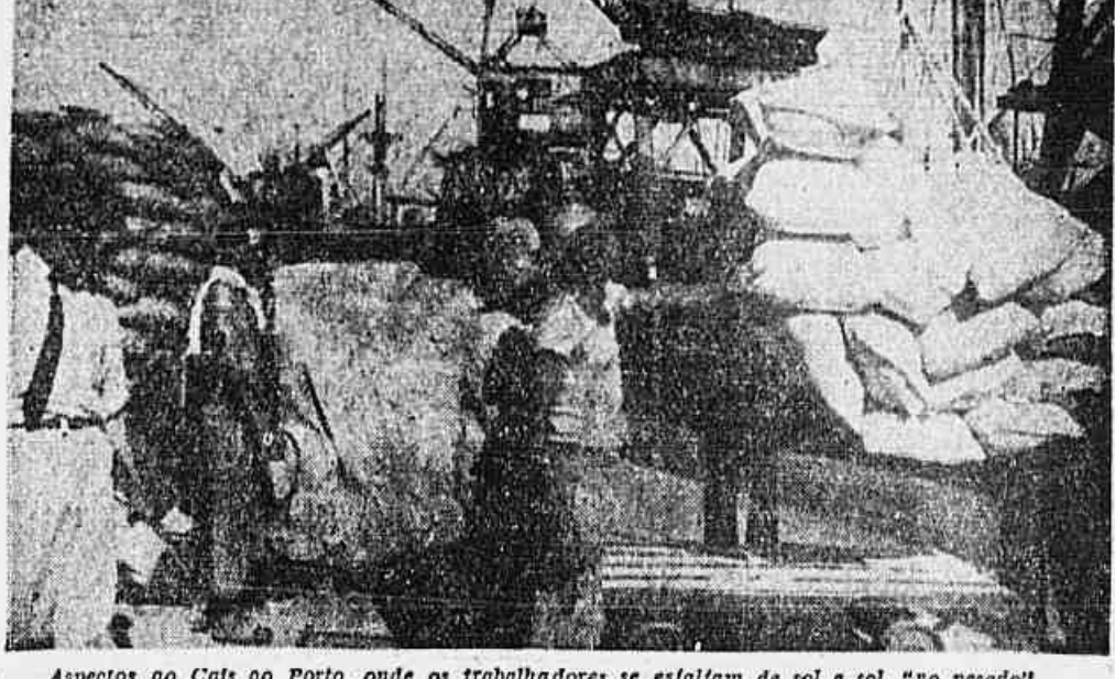
Aspectos ao Cais do Porto, onde os trabalhadores se esfaçam de sol a sol. "no pesado"