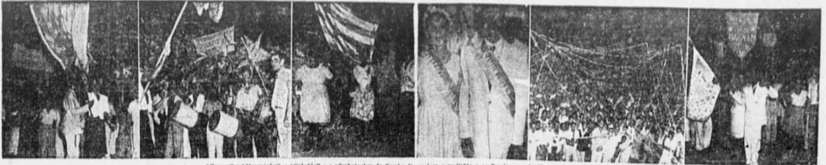
"Cavuca" e "Moreninha", o "Cidadão" e a "Embaixatriz do Samba", saudam a multidão e as Escolas que desfilaram em sua honra. (em)