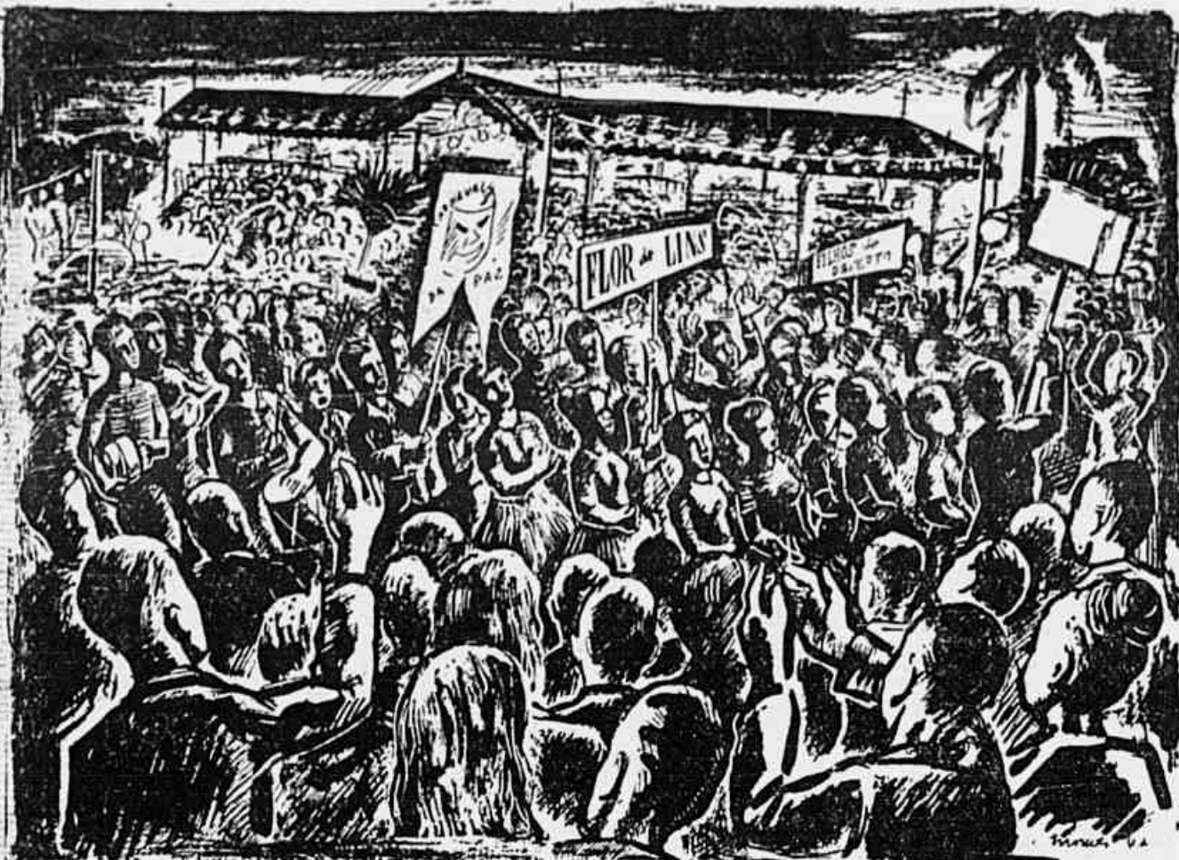
Uma visão panorâmica do desfile no Campo de São Cristóvão, desenhada pelo pintor José Morais

A festa do Campo de São Cristóvão foi uma prova eloquente do quanto pode o povo organizado, uma admirável demonstração de sua força criadora, e sobretudo uma comovente confraternização de massas, tanto a que aplaudia como a que se exibia nas dexas de blocos e Escolas de Samba, homenageando-se umas às outras e entendo, de mistura com as suas melodias, belas canções patrióticas de sua criação. Não houve o menor incidente em meio à imensa multidão que estacionava ou da que se deslocava constantemente no Campo durante o desfile. Nenhum espírito de hostilidade entre os milhares de bailari- nos que disputavam o aplauso público. Ao contrário, todos fizeram questão de que os seus antigos competidores, "Cavuca" e "Moreninha", vitoriosos num pleito honesto e livre, qual (CONCLUI NA 6.ª PAG.)