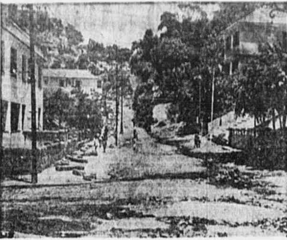
O FLAGRANTE ACIMA É A PARTE FINAL DA RUA SENADOR NABUCCO, entre as ruas Petróleo e Conselheiro Correia. Desde 1943 que se encontra, na Prefeitura, um processo para calçamento, requerido pelos moradores locais; datando o último parecer, de 2 de março do ano passado. Para facilitar o serviço da Prefeitura as famílias ali residentes se cotizaram e compraram as pedras do meio fio, que ainda se encontram, como vemos na gravura, abandonadas no local em que foram deparadas. Em carta que nos foi enviada, os prejudicados fazem um apelo ao prefeito Hildebrando de Góti, no sentido de dar início aos trabalhos de calçamento.