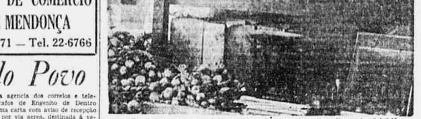
Este é o preço atual da cebola, Cr$ 3,50, que o produtor há poucos dias atrás, Cr$ 2,80