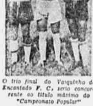
O trio final do Vaqueado do Encantado F. C. seria concorrente do título máximo do "Campeonato Popular".

ESPETACULAR O ENCERRAMENTO DAS INSCRIÇÕES PARA O CERTAME DE "TRIBUNA POPULAR" — AUMENTADA A LISTA DOS GREMIOS CONCORRENTES — NA PRÓXIMA SEMANA ESTARÃO EXPOSTOS OS PREMIOS — O ÚLTIMO CLUBE QUE FIZO INSCRIÇÃO — ENTUSIASMO DE DIRIGENTES E "CRACKS" PELA SENSACIONAL DISPUTA AMADORISTA