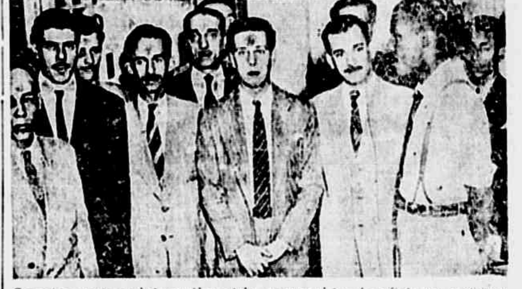
Comerciantes em nossa redação, convidam a todos os companheiros de profissão a manifestação de hoje, em defesa de um direito que está sendo ameaçado

SERA UMA VIGOROSA DEMONSTRAÇÃO EM DEFESA DA "SEMANA INGLESA - CONVITE A CORPORACAO