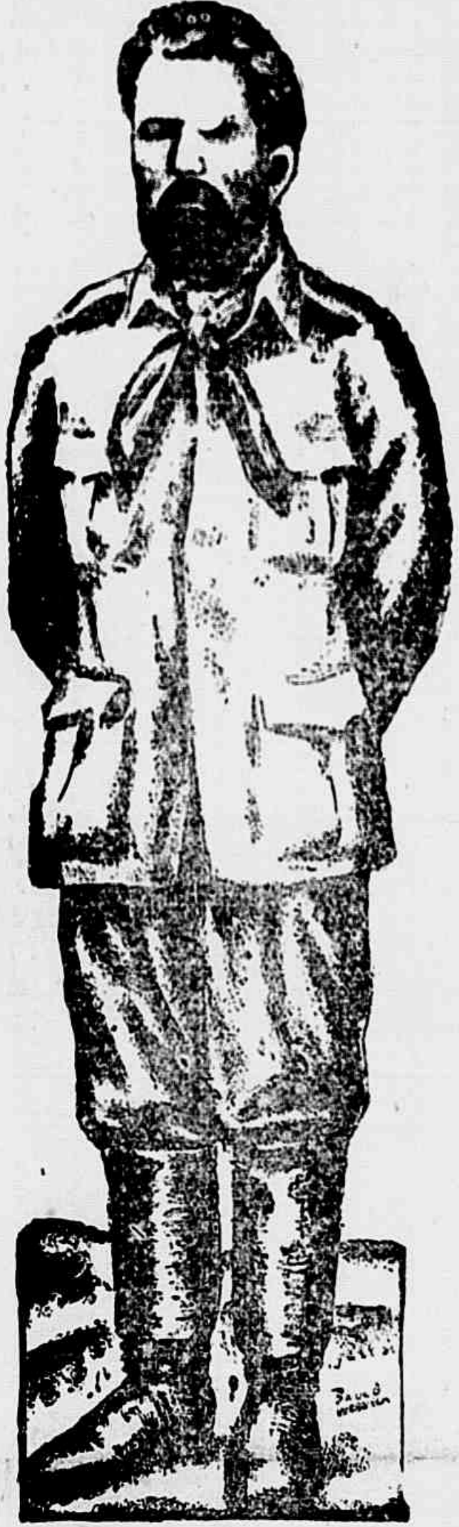
PRESTES, o Cavaleiro da Esperança, figura máxima das lutas do povo brasileiro pela sua independência e por uma verdadeira democracia