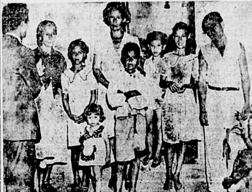
As últimas do Silveirinha falam à nossa reportagem