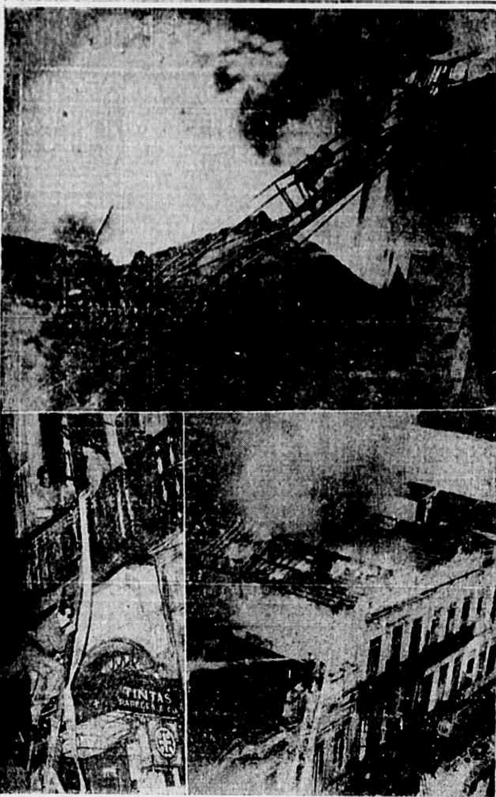
Três flagrantes do incêndio que destruiu completamente a casa de tintas da rua Buenos Aires e provocou danos em outros estabelecimentos comerciais, ameaçando todo o quarteirão. Em cima, um aspecto do fogo durante o prédio. Em baixo, os bombeiros em luta contra as chamas.

«Será humilhante, para todos os brasileiros, que nossos delegados, em Petropolis, se apresentem como representantes de uma ditadura — Nesta hora, mais do que nunca, os patriotas precisam unir-se em defesa da paz e contra a ofensiva imperialista»