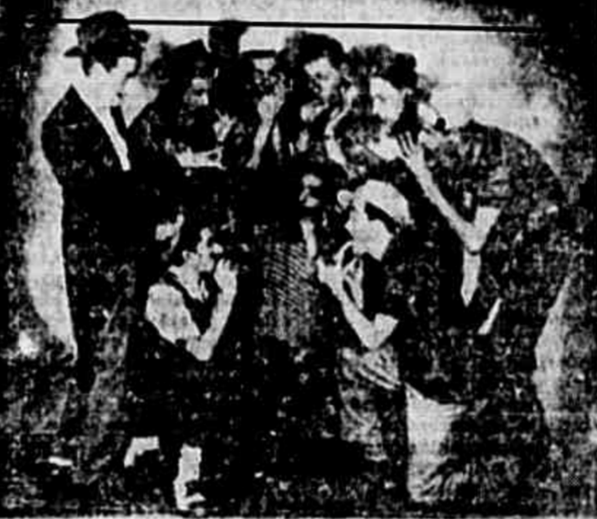
NOVAS comprem enxovais no rigor da moda na A NOBREZA 95 - Uruguiana - 95