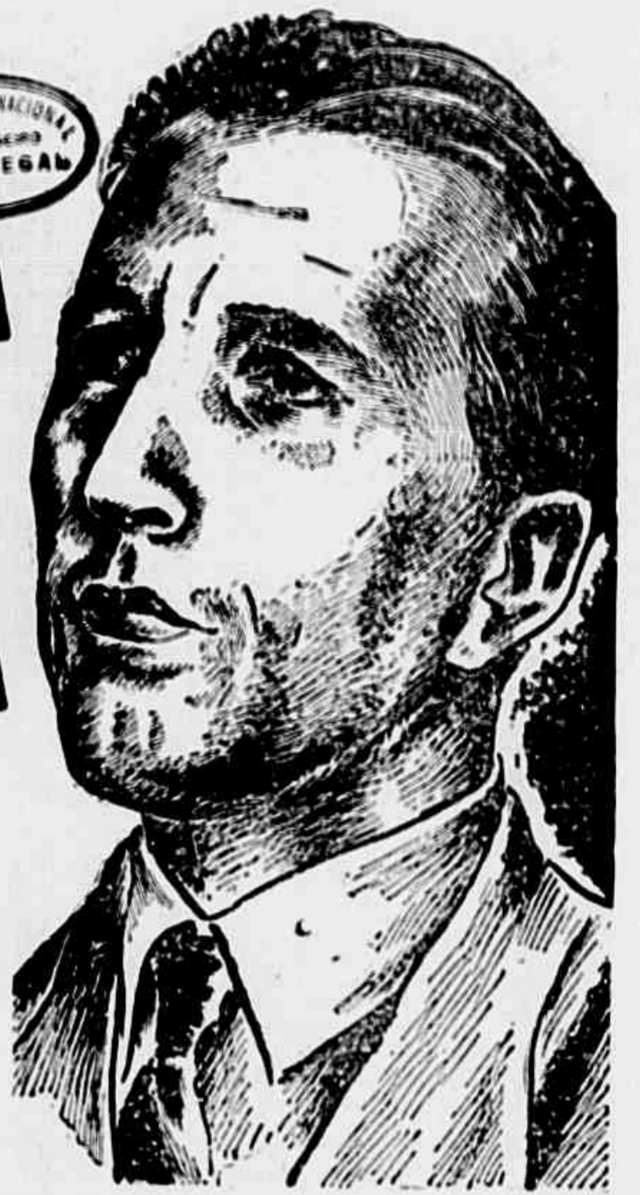
(Conclui na 2ª pág.)