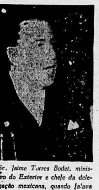
Sr. Jaime Torres Bodet, ministro do Exterior e chefe da delegação mexicana, quando falava

O DISCURSO DO SR. DUTRA — RESPONDE, EM NOME DOS DELEGADOS, O CHANCELER DO MÉXICO, SR. TORRES BODET — FALA O SR. TRYGVE LIE, SECRETÁRIO GERAL DA O.N.U. — A SESSÃO DE FIM DE TARDE — A ORDEM DO DIA DE HOJE — OUTRAS NOTAS