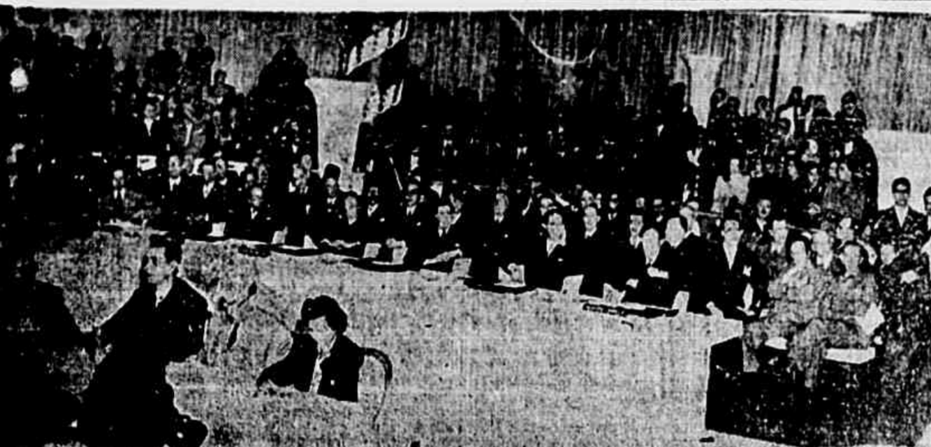
Aspecto da sessão de instalação da Conferência de Petrópolis

— Na verdade essa tão propagada fraternidade pan-americana não tem sido senão o privilégio conquistado pouco a pouco pelos banqueiros lanques de explorar nossos povos, mantidos no atraso e na ignorância, sistematicamente espoliados pelo capital estrangeiro, com suas economias nacionais deformadas porque orientadas não no sentido do progresso nacional de cada povo vítima, mas de acordo com os interesses dos trusts e monopólios lanques. Esse pan-americanismo desigual, essa pretensa fraternidade do explorador com os explorados, não tem sido senão a máscara do avanço progressivo do explorador, por quem ou por mal, mesmo a custa de conflitos tão sangrentos como a guerra imperialista do século entre interesses ingleses e norte-americanos. Esse é um pan-americanismo de fachada que nem ao menos serve aos povos para ajudá-los a se livrar dos seus opressores mais odiados: é