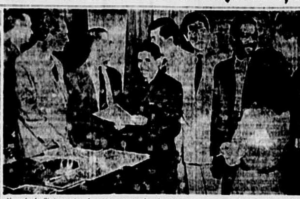
Na sede do Sindicato dos Aeroaviários, associados discutem com o presidente da Junta diversos detalhes para a realização do grande baile de aniversário do dia 23 próximo...