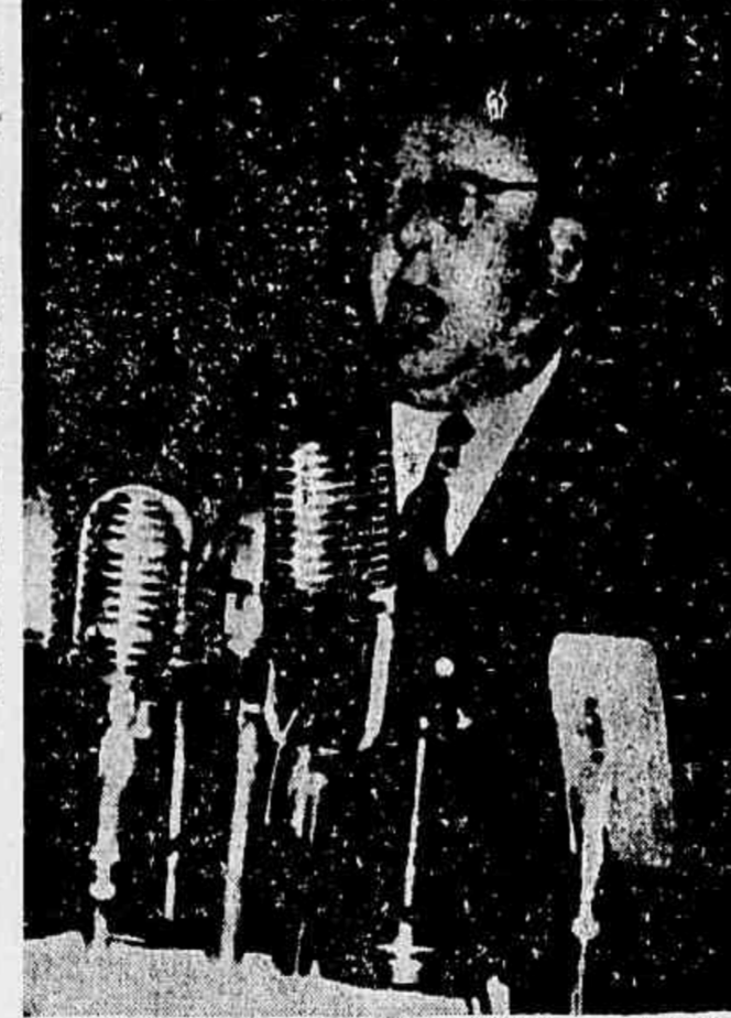
Sr. Trygve Lie, secretário geral da O.N.U., quando falava na sessão de instalação da Conferência Inter-Americana, ontem realizada em Petrópolis

Em seu discurso, o general Eurico Dutra apresentou as boas vindas aos delegados, em nome do governo e do povo do Brasil, e disse que diante deles viera à sua lembrança aquele congresso de povos americanos, sonhado por Bolívar. As Repúblicas Americanas se encontram reunidas — prosseguiu — em sociedade de nações livres, soberanas e independentes, mas ligadas por laços íntimos de solidariedade e pelo propósito comum de forjar um instrumento de ação que lhes assegure os benefícios da paz em que têm vivido. Recordou o caminho percorrido no trabalho de criação jurídica e política, frisando que já foram adotados para o futuro Código de Direito Público da América: o princípio da igualdade jurídica dos Estados; a proscricção da guerra como instrumento de política; o não reconhecimento das conquistas realizadas pela força; a não intervenção dos Estados nos negócios internos uns dos outros; o arbitramento como meio de solução de disputas internacionais; o reconhecimento de que toda guerra ou ameaça põe em perigo os princípios de liberdade e justiça, normas políticas da América. E para coroar essa obra a América rematou-as com a declaração da solidariedade coletiva em face de qualquer agressão contra Estados deste Continente. É a essa declaração de solidariedade — ponderou — que são chamados os delegados a dar forma contratual e força executória, "consubstanciando-a no texto de um pacto de defesa continental".