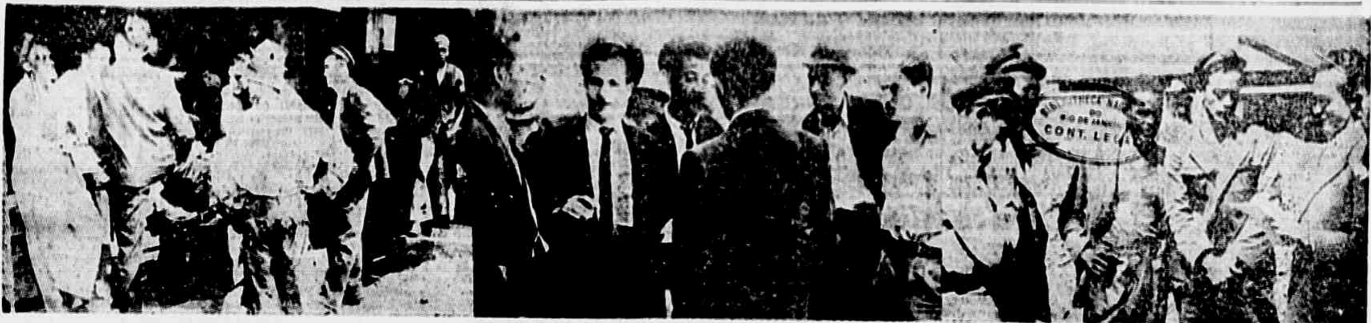
E INDISCRITIVEL O ENTUSIASMO POPULAR PELA REALIZAÇÃO, HOJE, DO GRANDE COMICIO, COMEMORATIVO DO ROMPIMENTO DE RELACOES DO BRASIL COM OS BANDIDOS DO EIXO — No clichê acima, aparecem os trabalhadores da Light e da Leopoldina, que se manifestaram ao nosso repórter o seu contentamento pela extraordinária significação de se comemorar a reconquista do povo, da sua liberdade de reunião em praça pública, direito elementar em todas as democracias do mundo, em data tão cara aos sentimentos anti-fascistas do povo carioca. "E mesmo que abate de novo as portas da democracia em nossa Pátria" — disseram-nos alguns dos balhadores. "O povo não se esquece da vitória da P.R.B." — dizem outros. — (REPORTAGEM NA 2ª PAGINA).