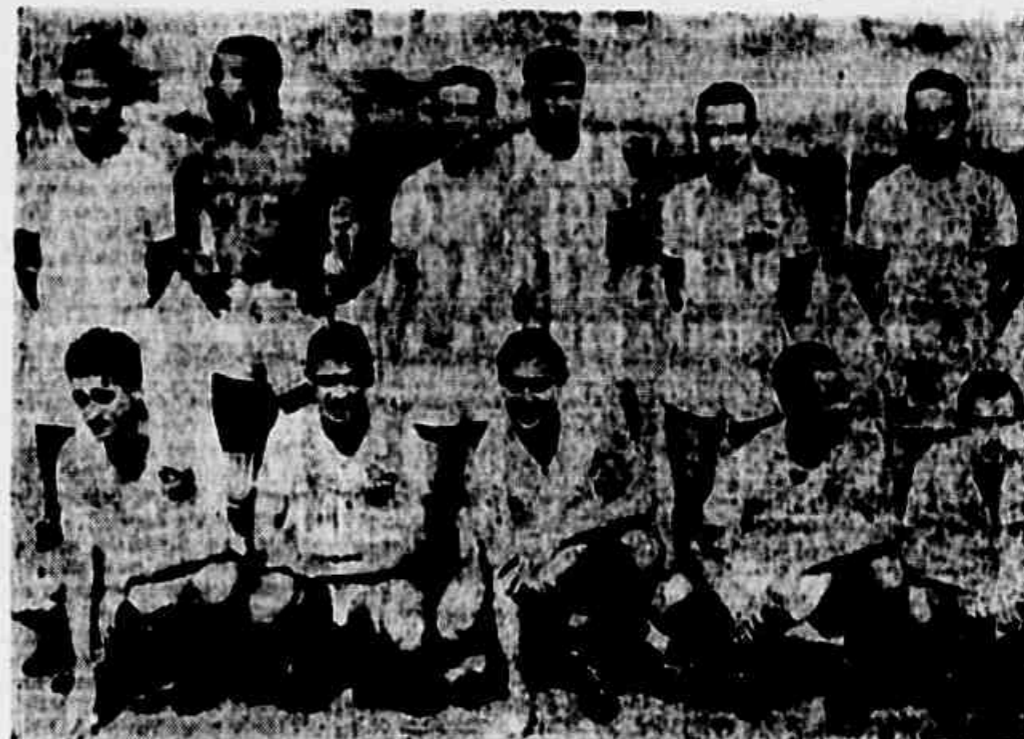
A equipe do São Cristóvão, ainda longe da melhor forma. Os alunos, entretanto, estão animados, esperando um resultado favorável na partida de domingo.