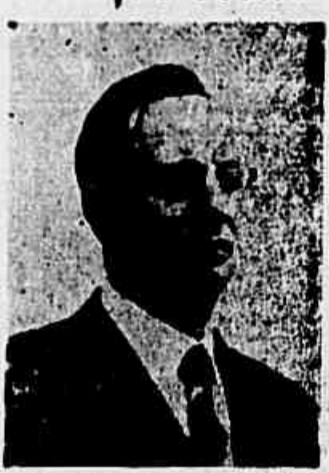
Sr. Luis Batlle Berres, presidente do Uruguai

Declarar que a humanidade está vivendo uma revolução social e política que agita todos os povos. Ninguém pode pretender que nos coloquemos à margem desse movimento para abominá-lo e apredê-lo. O que o momento exige é entrar e fazer parte dessa imensa coluna para brincar, para dirigir as forças em marcha, ainda que para isso seja preciso acelerar a nossa evolução. O sr. Batlle Berres dedicou o maior parte do seu discurso aos problemas imediatos do povo, entre eles o da carestia da vida. A produção nacional de certos artigos não dá para o consumo interno. O Estado precisa intervir, distribuídos na produção como prêmio, para evitar que seus preços no varejo aumentem. Essa política custará este ano ao governo cerca de 250 milhões de pesos (250 milhões de cruzeiros). Ora, isso não pode continuar. É preciso aumentar a produção. E uma das causas dessa produção insatisfatória está no regime da propriedade da terra. Esse regime (arrendamentos altos de campo pagos pelos produtores de leite) é uma das causas do preço que o povo está pagando por esse alimento essencial, e por outros. Disse o propósito o presidente Batlle Berres: — O pagamento de tais arrendamentos em favor dos que vivem tranquilamente do trabalho, dos que se esforçam para criar