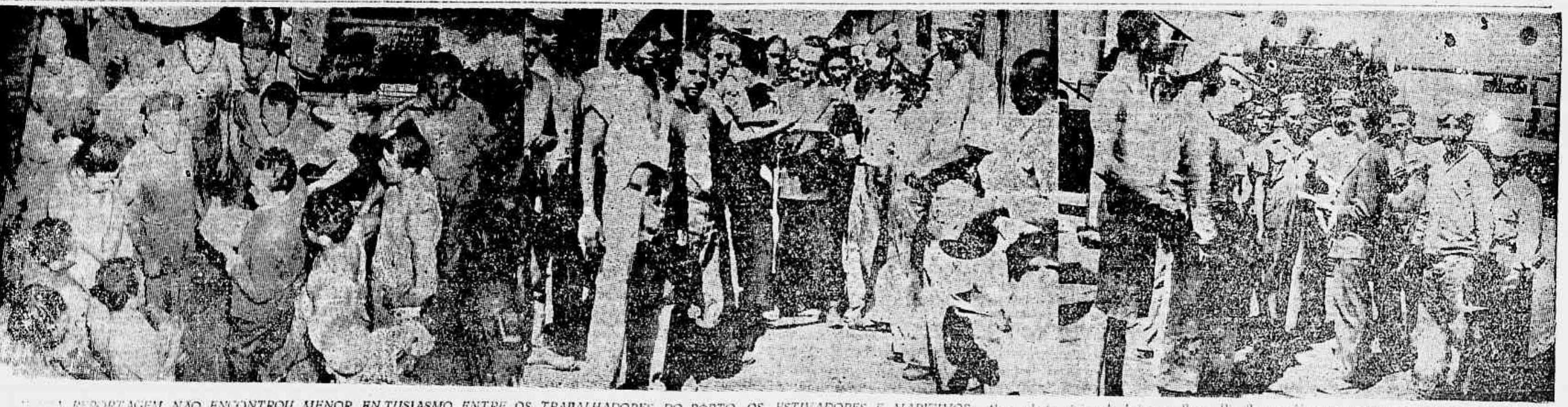
REPORTAGEM NÃO ENCONTROU MENOR ENTUSIASMO ENTRE OS TRABALHADORES DO PORTO, OS ESTIVADORES E MARITIMOS, sobre a festa cívica de hoje, na Praça Rio Branco. Na gravura que está acima, vemos os filhos mobilizados cercando a reportagem da TRIBUNA POPULAR para que assinásemos o jornal de que se achavam possuídos, com a expectativa do comício que aspiravam mais uma vez o acontecido após 10 anos da democracia e 40 anos de fascismo e de opressão. — (REPORTAGEM NA 2ª PAGINA).

PETROPOLIS, 21 — Urgente (Dos enviados especiais da TRIBUNA POPULAR) — A delegação do México, com as assinaturas de quatorze nações, inclusive a Argentina, apresentou uma proposta no sentido de que seja realizada uma conferência econômica interamericana entre os meses de abril e agosto de 1948, depois, portanto, da Conferência de Bogotá. Os Estados Unidos não assinaram a proposta mexicana, que conta, entretanto, maioria de dois terços.