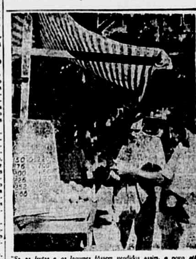
Se as frutas e os legumes fossem vendidos assim, o povo até podia dar um suspiro de alívio