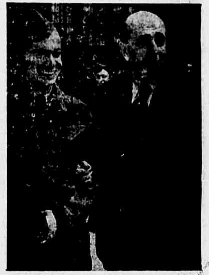
O sr. Jan Masaryk, durante uma das suas visitas à Inglaterra, falando por um soldado checo. O ministro do Exterior da Checoslováquia, manifestou na Assembléia da ONU, a oposição de seu país, às modificações que pensam introduzir na Carta das Nações Unidas, para torpedear o esteio máximo da paz e da segurança mundiais: a unanimidade entre as grandes potências

Depois da oração do sr. Masaryk fez uso da palavra o delegado do Líbano, sr. Camille Chamoun, que se referiu ao problema da Palestina e desafiou o sr. Marshall a enunciar o princípio sobre o qual baseava "o selo de sua aprovação à mutilação da Palestina". Em seguida, o discurso proferido em princípios desta semana, no selo da Assembléia, pelo sr. Marshall como um índice de aprovação dos Estados Unidos à recomendação do Comitê das Nações Unidas sobre