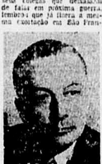
Sr. Georges Bidault, que, em nome da França, se opôs à abolição do direito de veto.

O primeiro orador foi o sr. Masaryk que manifestou a oposição de seu país a qualquer modificação direta ou indireta da Carta das Nações Unidas, que substitua a norma de unanimidade ou veto pela maioria de votos, tal como foi proposto nos dias pelo secretário do Estado norte-americano, sr. George Marshall. Em seguida, o sr. Masaryk mencionou que muitas questões políticas de importância mundial são resolvidas fora da Organização Mundial das Nações Unidas e, ao rogar aos