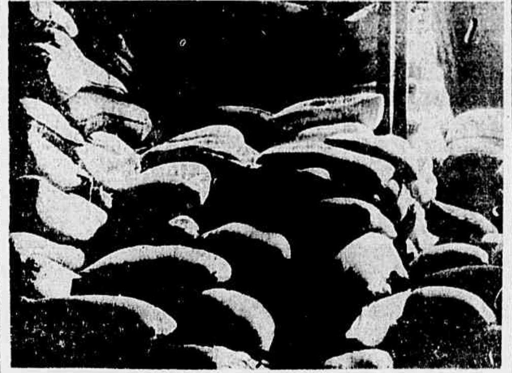
O feijão preto falta na marmitta do trabalhador, enquanto os açambarcadores vão esticando grandes quantidades para especular