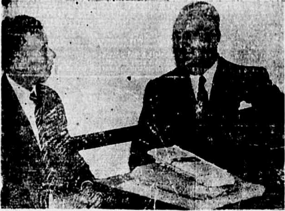
O ex-senador Adhemar de Barros, Presidente do Partido Popular Progressista, quando falava no uso redator

ANO III * N.º 709 * DOMINGO, 21 DE SETEMBRO DE 1947