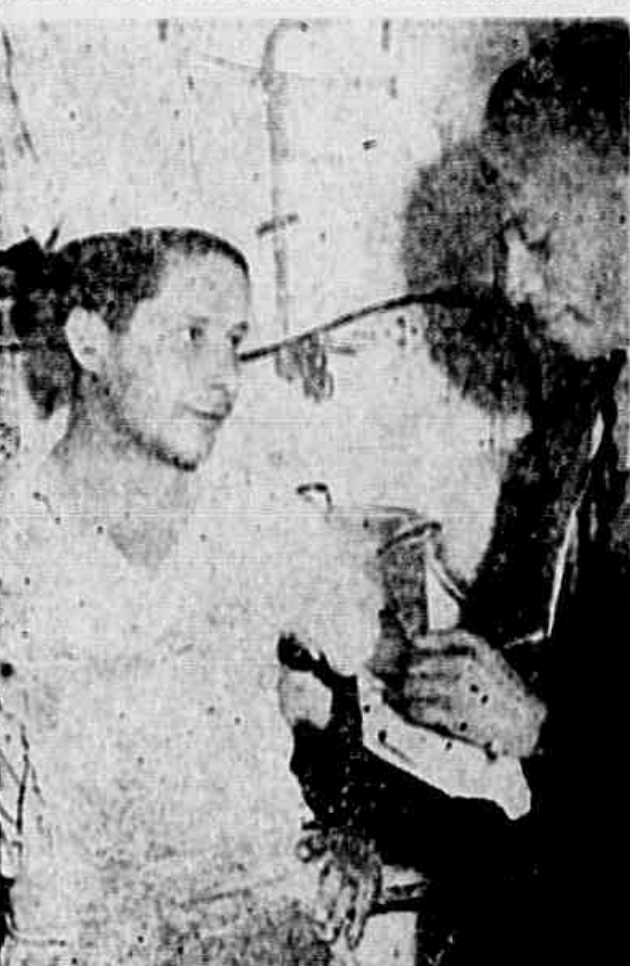
No Café Luzadas, à rua da Assembleia, o reporter ouve um cafeiteiro, que manifesta a sua confiança na vitória de amanhã, na Justiça do Trabalho.