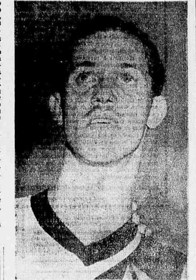
Atacante, atacante do Fla x Flu, o meio atacante comandará a equipe das Laranjeiras na luta pelo título.

válvulas e material elétrico DIMAS & C. AVENIDA MEM DE SA, 186 Tel. 32-0019