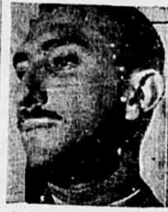
Deputado Mauricio Grabois