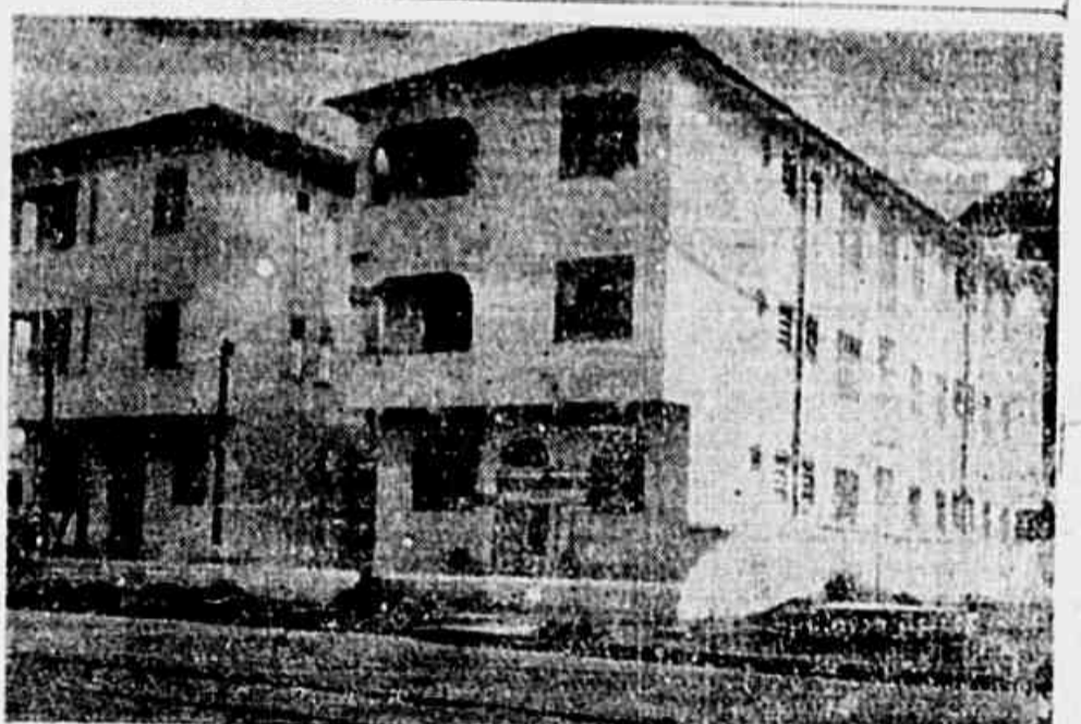
Estão os dois edifícios da rua Bartolomeu Mitre, 151 e 163 — seus apartamentos estão vazios a espera de venda, enquanto falta casa para o povo