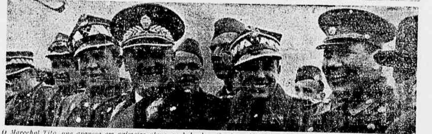
O Marechal Tito, que aparece em primeiro plano, ao lado de oficiais soviéticos e poloneses, assistindo a uma parada militar

Você vai, logo se vê... Se vai de trem, como parece, escolha o que lhe convém. Partidas da Estação D. Pedro II: 6,55 — 7,35 — 8,15 — 9,02. Saite na estação de Santa Cruz, onde encontrará condução para a Festa de Sepetiba (Cílio do Dr. Sidney Rezende).