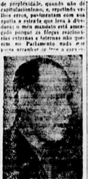
Deputado Henrique Oest