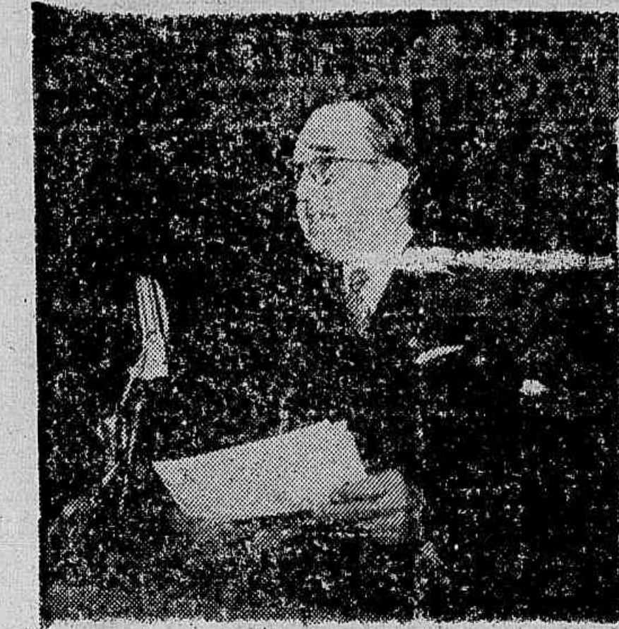
Dr. AFONSO CASO, famoso outropologista, ex-ministro e membro da delegação mexicana no Congresso Continental.

Como se sabe nos Estados Unidos são os próprios operários que contribuem com parte de seus salários para o chamado fundo de "seguros sociais", que na URSS estão cargo exclusivo do Estado socialista. Devido à tentativa dos patrões de sobrecarregar mais ainda os salários com novas taxas, foram à greve e nela ainda se encontram mais de um milhão e meio de operários norte-americanos da indústria do aço, carvão, transportes ferroviários e serviços conexos. No entanto a United States Steel o mais poderoso truste de aço do mundo capitalista, acaba de revelar que os seus lucros no primeiro trimestre do corrente ano foram maiores já auferidos em qualquer período em tempo de paz. Totalizaram 50 milhões de dólares, ou 5 dólares por ação, quando no mesmo período do ano passado tinham sido de 27 milhões de dólares e 2 dólares e 49 cents por ação. Quer dizer quase dobraram de um ano para outro. Como se vê, a preparação da guerra proporciona grandes lucros aos magnatas norte-americanos, ao mesmo tempo que milhões de operários perdem o emprego e outros milhões vão à greve para não terem seus salários rebaixados.