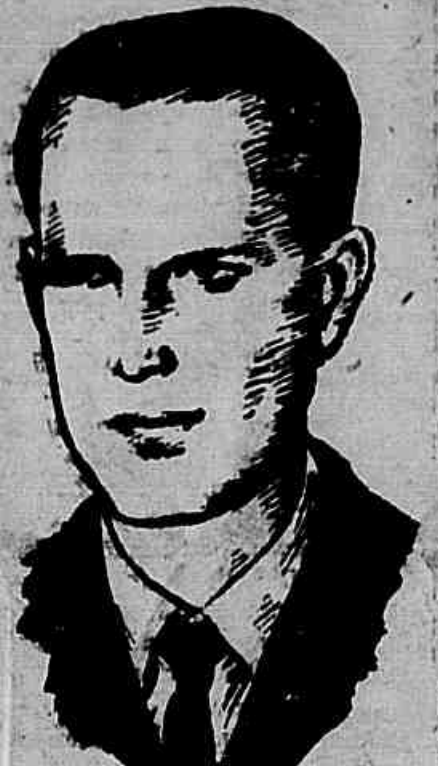
AFONSO MARMA, o heroico dirigente comunista, assassinado em Tupã. Marma, Rossi e Godoy são hoje um símbolo da bravura revolucionária do povo trabalhador e o sangue que derramaram pela causa do povo é uma sementeira de novos lutadores, dignos deles e forjados no exemplo