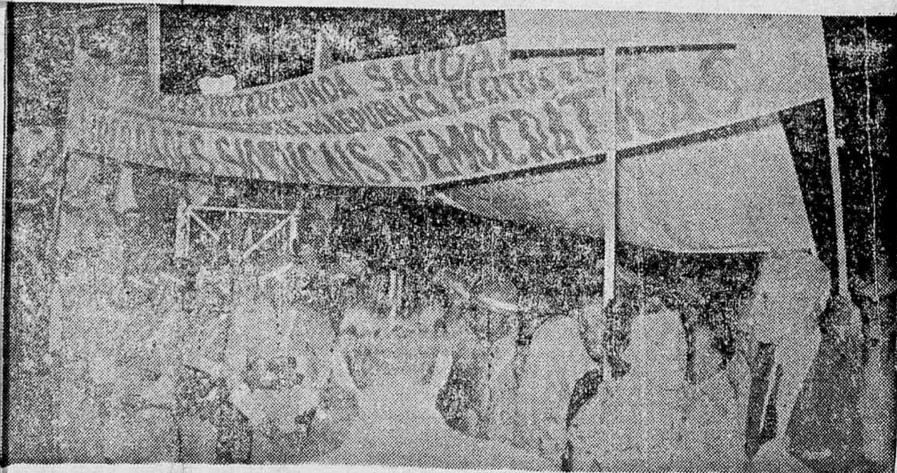
Uma comissão de trabalhadores de Volta Redonda compareceu ao comício carregando uma faixa em que saudam o presidente Kubitschek e exigem amplas liberdades democráticas e sindicais.

As violências da policia causaram geral indignação, constituindo uma nota dissonante na manifestação com que o povo carioca apresentou suas reivindicações democráticas ao presidente eleito da República, de volta da viagem ao exterior.