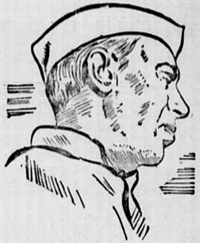
NEHRU, Primeiro Ministro da Índia

Onde, pois, foram os que procuram ligar o Brasil ao desengonçado carro do colonialismo buscar argumentos senão nas fontes norte-americanas e salazaristas, interessadas únicas na continuação do domínio português em