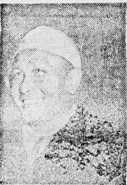
A COMUNIDADE de interesses para o desenvolvimento independente faz com que se estreitem consideravelmente as relações entre os Estados asiáticos. U Nu (na foto), primeiro-ministro da Birmânia, antigo lutador pela emancipação de sua Pátria, recebeu em Rangun a visita de Tchu En-lai, presidente do Conselho da China Popular.

EM princípios de fevereiro, encontrar-se-ão, em território birmanês, o primeiro ministro da China, Tchu En-lai e o primeiro ministro da União Birmanesa, U Nu. Reforça-se, assim, cada vez mais, a amizade entre a Birmânia e os países do campo socialista. E isso é natural.