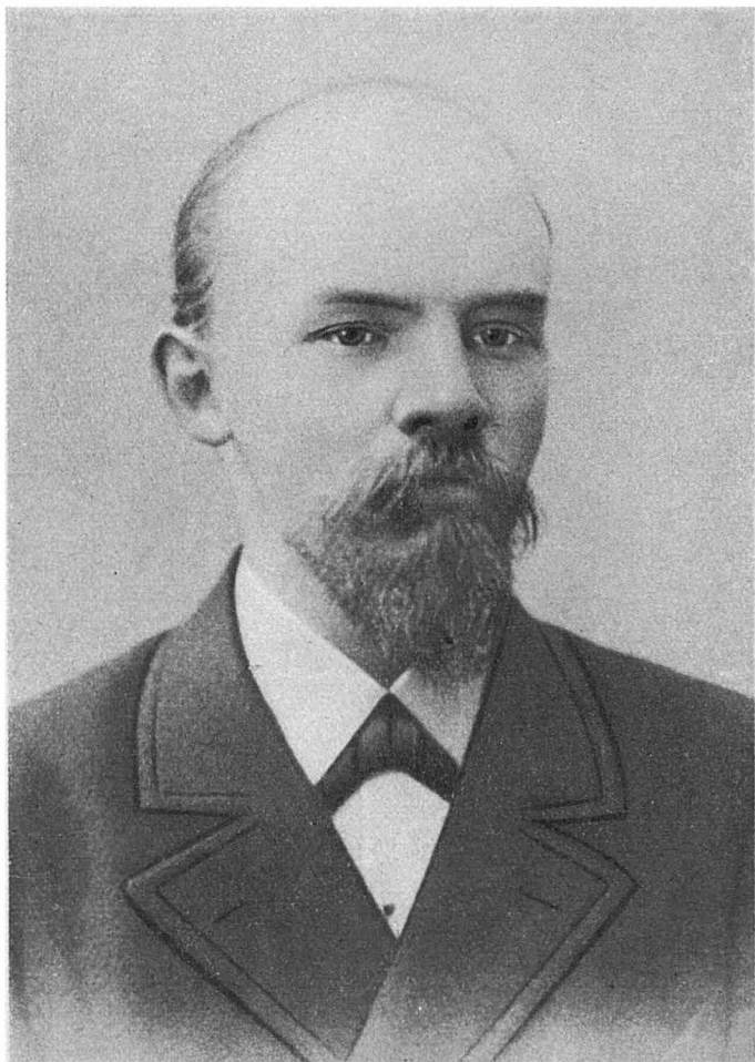
V I. LENIN 1897