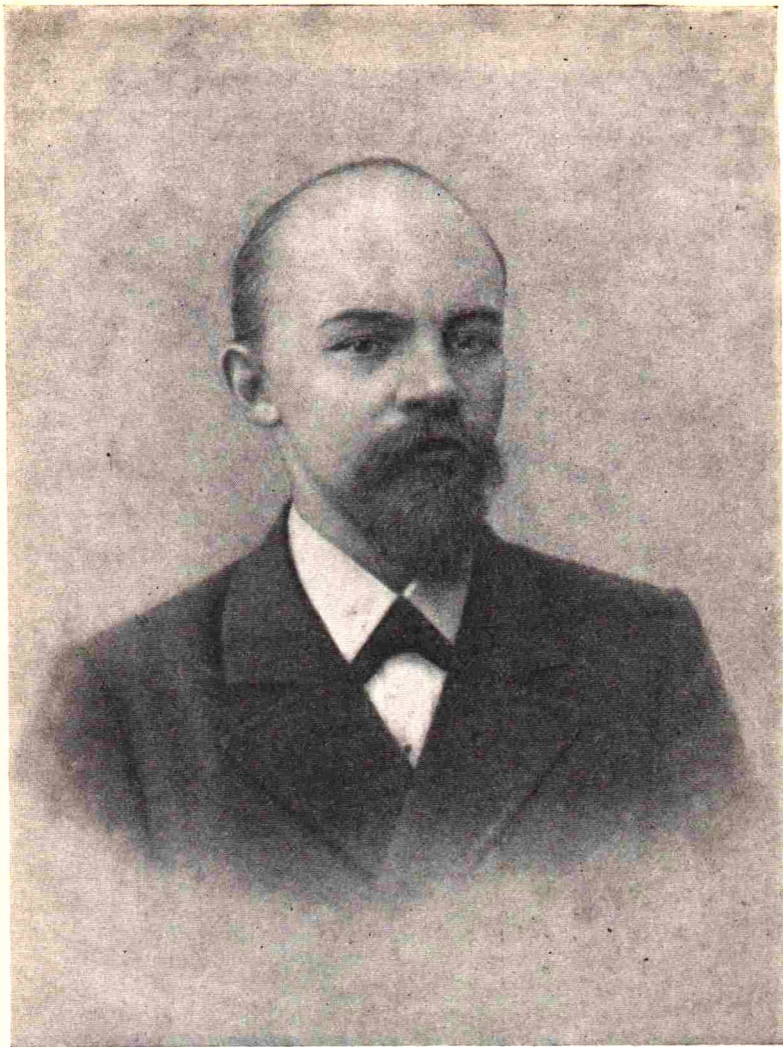
V. I. Lenin. Valokuva, 1897.