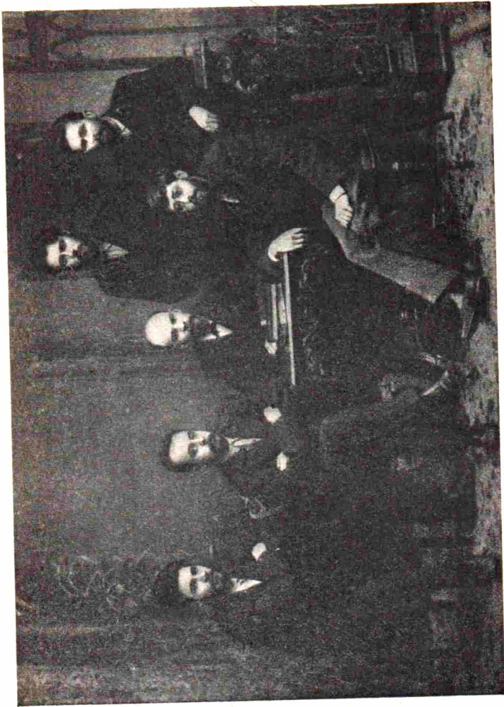
Ryhmä Pietarin „Taisteluliiton työväenluokan vapauttamiseksi” perustajia V. I. Leninin seurassa. Valokuva, 1897.