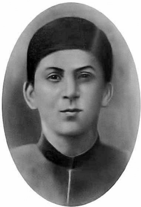
J. V. STALIN. Valokuva, v. 1894.