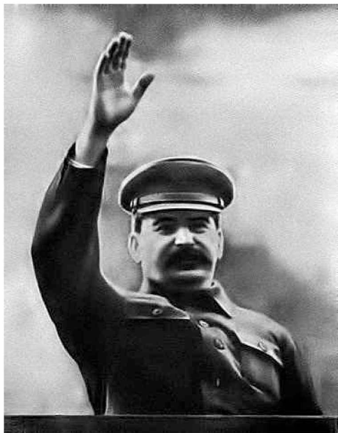
J. V. STALIN