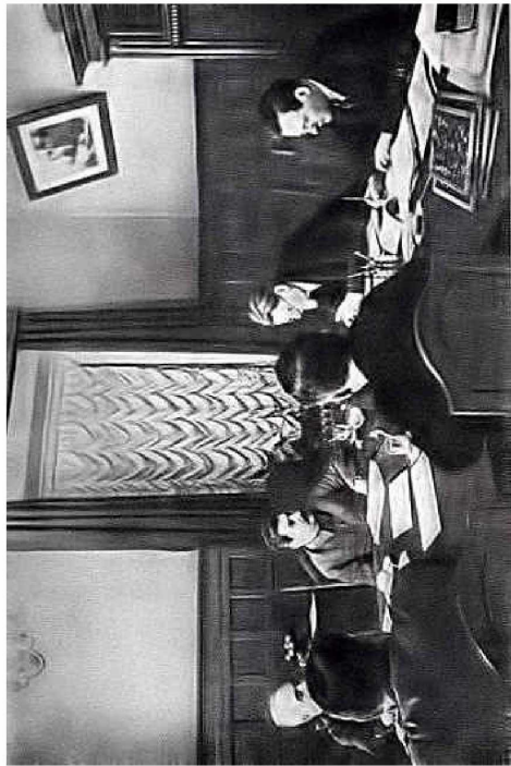
Neuvostoliiton Korkeimman Neuvoston Puhemiehistöön istunto. Valokuva.