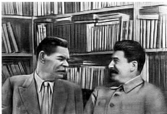
J. V. Stalin ja A. M. Gorki. Valokuva.