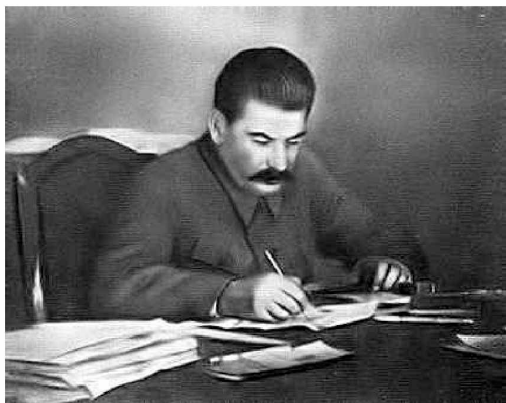
J. V. Stalin työhuoneessaan. Valokuva.