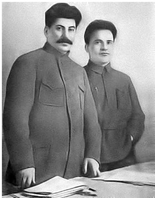
J. V. Stalin ja S. M. Kirov. Leningrad. V. 1926. Valokuva.