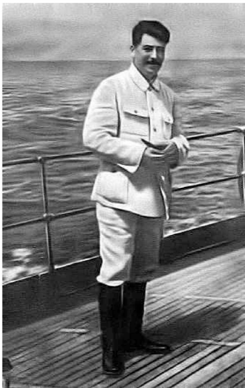
J. V. Stalin Mustan meren laivaston risteilijän „Tshervona Ukraina“ kannella. Heinäkuun 25 pnä 1929. Valokuva.