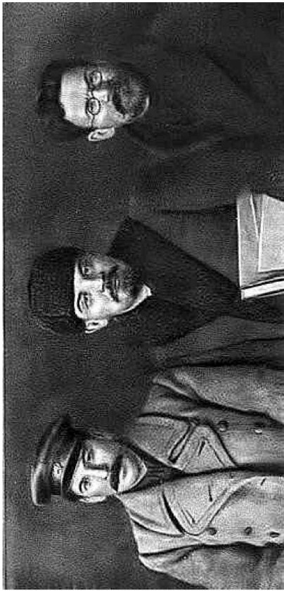
in, J. V. Stalin ja M. I. Kalinin VKP(b):n VIII edustajakokou- Maaliskuuta v. 1919. Valokuva.