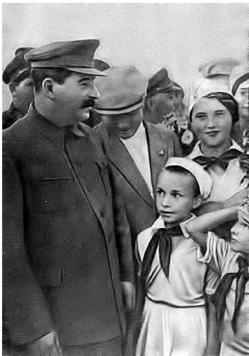
V. Stalin lasten keskuudessa Tushinin lentokentällä. V. 1936. Valokuva.