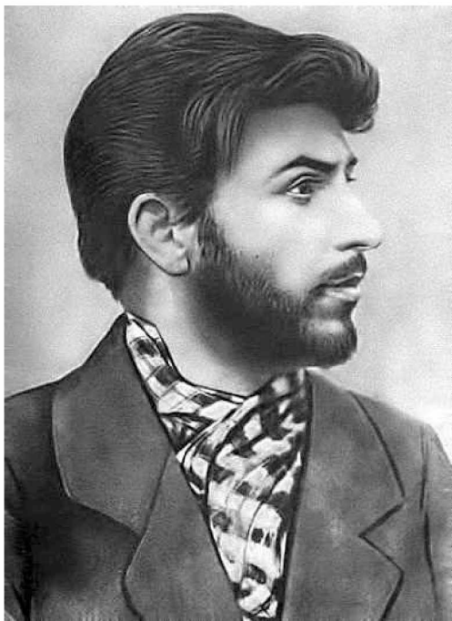
J. V. STALIN. Valokuva, v. 1900.