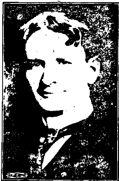
John J. McNamara

Aina siitä asti jolloin ns. Haywoodjuttu Western Federation of Miners'in virkailijoita vastaan entisen kuvernöörin Steunenbergin murhaamisesta Idahossa oli käsiteltävänä, ei työläisten keskuudessa ole kiinnitetty niin suurta huomiota millekään oikeusjutulle kuin nykyiselle McNamara veljesten jutulle. Näitä veljeksiä syytetään osallisuudesta sen dynamiittiräjähdyksen toi-