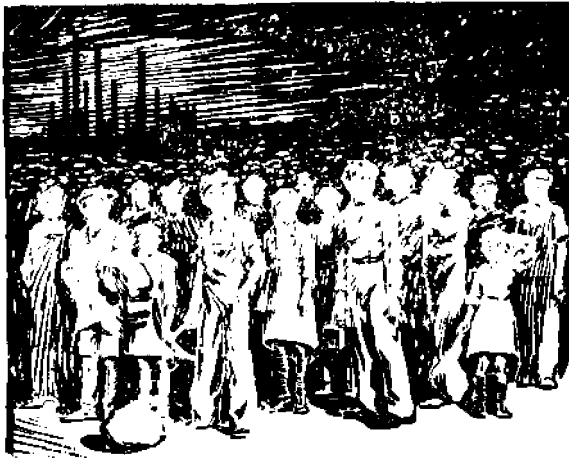
Köyhällistää — Missä on heidän "hyvä aikansa?"