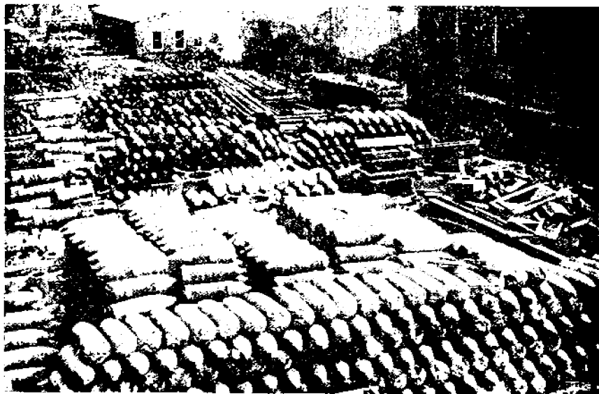
Räjähälyskäulavarasto Bethlehemin terästehtaan pihamaalla.