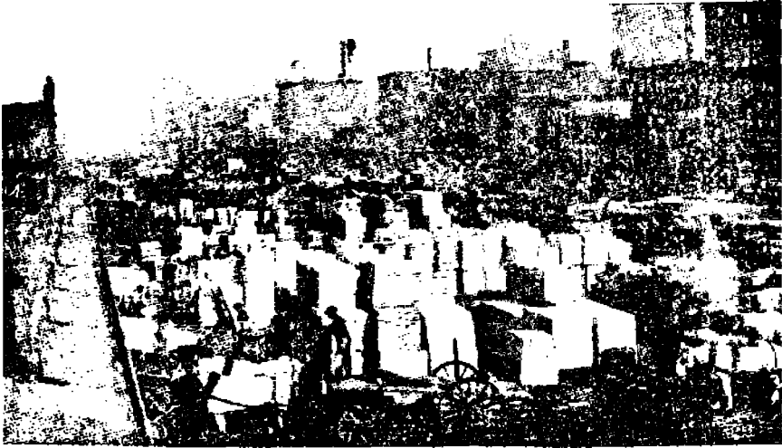
Pikakuva New Yorkin satamalatturilta.