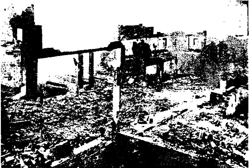
Hävitystä — ei sodassa.

Yksi Du Pont yhtiön tehtaista, Carney'n tehdas, joka valmistaa savutonta ruutiä, valmistaa sitä päivässä noin 730,000 paunaa. Paunaa kohden nousevat valmistuskustannukset 50 senttiin, siinä tietenkin jo luettuna huomattava osa työnantajille. Tätä ruutiä myydään sitten Euroopan dollari pannaalta. Yhden päivän voitoksi jää siis $365,000. Tämä tarkoittaa kaksi miljoonaa dollaria viikossa "puhdasta