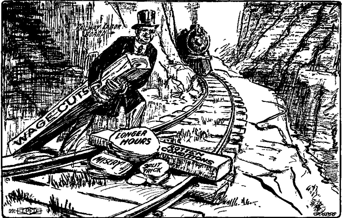
Railroad Workers Union Bulletin.

Kapitalistien annokset rautateiden työläisille.