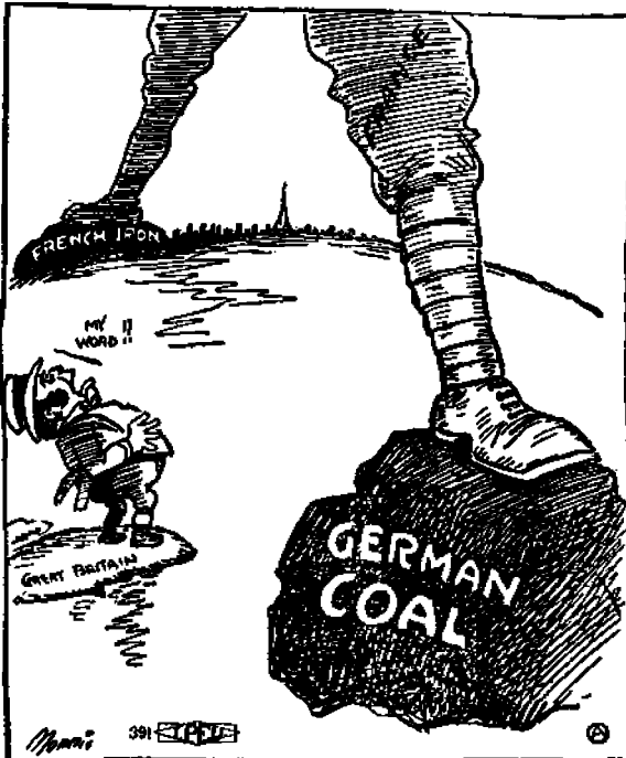
Saksan tuotanto Ranskan rautakoron alla.

Ne piirteet, mitkä Euroopassa aiheuttavat nykyisen säälittävän tilanteen, voidaan lyhyesti jakaa